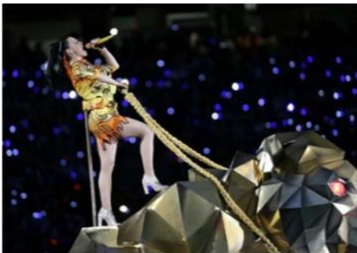
Katy Perry – “Escúchame rugir” Super Bowl 2015